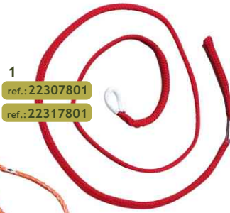
1 ref.: 22307801 ref.: 22317801