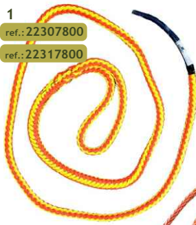
1 ref.: 22307800 ref.: 22317800