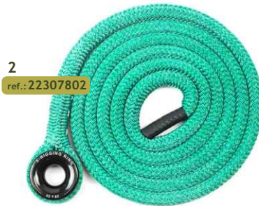
2 ref.: 22307802