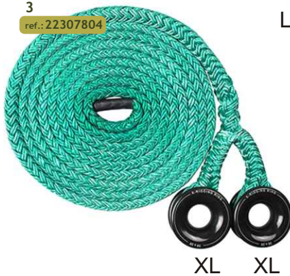
3 ref.: 22307804