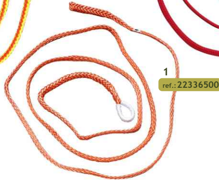
1 ref.: 22336500