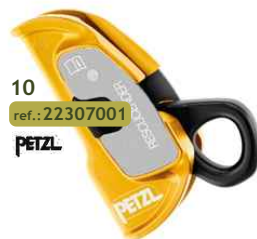
10 ref.: 22307001 PETZL