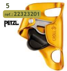
5 ref.: 22323201 PETZL