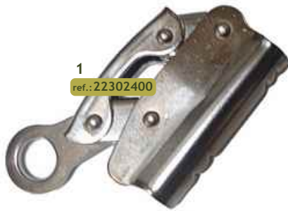
1 ref.: 22302400