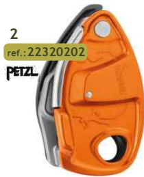
2 ref.: 22320202 PETZL