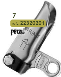
7 ref.: 22320201 PETZL