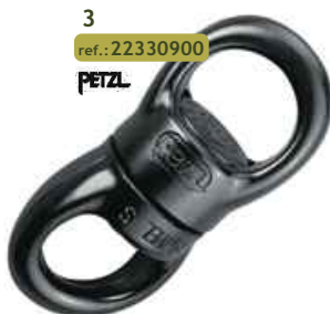
3 ref.: 22330900 PETZL