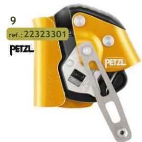
9 ref.: 22323301 PETZL