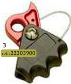
3 ref.: 22303900