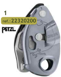
1 ref.: 22320200 PETZL