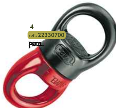
4 ref.: 22330700 PETZL