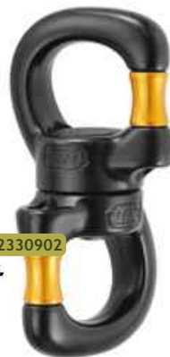
2 ref.: 22330902 PETZL