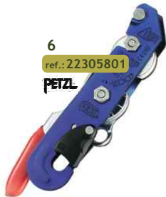
6 ref.: 22305801 PETZL