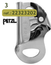
3 ref.: 22323202 PETZL