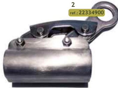
2 ref.: 22334900