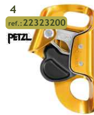
4 ref.: 22323200 PETZL