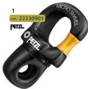
1 ref.: 22330901 PETZL