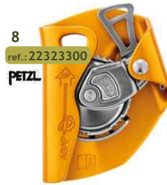
8 ref.: 22323300 PETZL