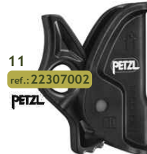
11 ref.: 22307002 PETZL